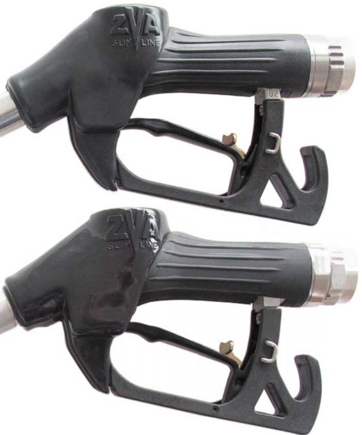
KOPIE ("Great Wall")